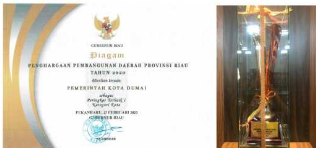
Gambar 9 Perhargaan PPD Tingkat Provinsi Yang Diterima Bappeda Kota Dumai Tahun 2020