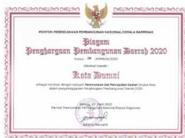
Gambar 8 Perhargaan PPD Tingkat Provinsi Yang Diterima Bappeda Kota Dumai Tahun 2020