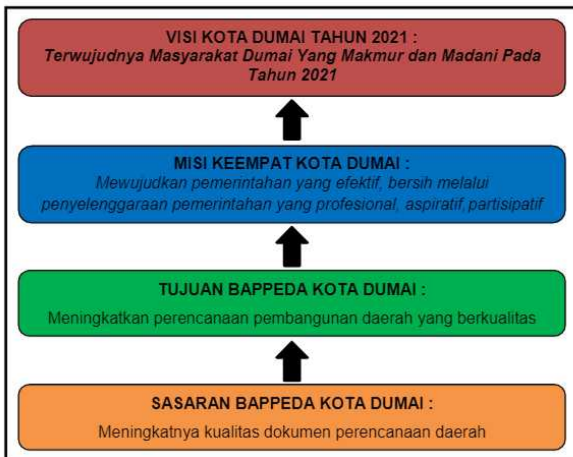
Gambar 5 Keterkaitan Visi dan Misi Kota Dumai dengan Tujuan dan Sasaran Bappeda Kota Dumai Tahun 2016-2021

Untuk mewujudkan Visi dan Misi Pembangunan Tahun 2016-2021 sebagaimana tercantum dalam Perubahan Rencana Pembangunan Jangka Menengah Daerah (P-RPJMD) Kota Dumai Tahun 2016-2021, Badan Perencanaan Pembangunan Daerah (BAPPEDA) Kota Dumai menetapkan tujuan dan sasaran strategis yang dituangkan dalam Perubahan Rencana Strategis Badan Perencanaan Pembangunan Daerah (P-Renstra BAPPEDA) Kota Dumai Tahun 2016-2021. Keterkaitan antara Visi dan Misi Pembangunan Tahun 2016-2021 dengan Tujuan dan Sasaran Strategis BAPPEDA Kota Dumai Tahun 2016-2021 dapat dilihat pada Gambar 5.