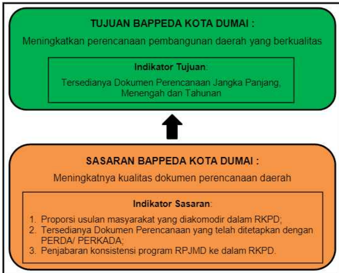
Gambar 6 Indikator Kinerja Utama BAPPEDA Kota Dumai Sumber: Renstra BAPPEDA Kota Dumai Tahun 2016-2021

Sesuai dengan tugas dan fungsinya sebagai penunjang urusan pemerintahan bidang perencanaan pembangunan daerah, Bappeda Kota Dumai dituntut untuk mampu menghasilkan perencanaan pembangunan daerah yang lebih berkualitas melalui peningkatan kualitas dokumen perencanaan daerah. Untuk mewujudkan tujuan dan sasaran yang sudah ditetapkan, maka indikator kinerja utama Bappeda Tahun 2019 tersaji pada Gambar 6.