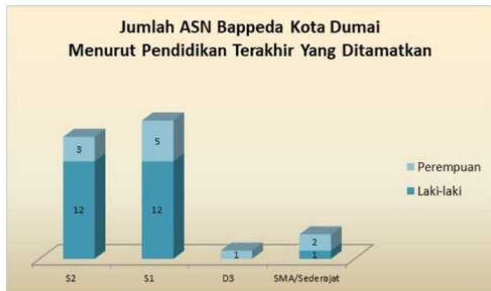
Gambar 2 Jumlah Aparatur Sipil Negara (ASN) BAPPEDA Kota Dumai Menurut Pendidikan Terakhir Yang Ditamatkan

Jumlah Aparatur Sipil Negara (ASN) Badan Perencanaan Pembangunan Daerah (BAPPEDA) Kota Dumai per Desember 2020 adalah sebanyak 36 (tiga puluh Enam) orang, dimana 69,44% (25 orang) berjenis kelamin laki-laki dan 30,56% (11 orang) berjenis kelamin perempuan. Adapun pendidikan formal terakhir yang ditamatkan ASN BAPPEDA Kota Dumai 2020 tersaji pada Gambar 2.