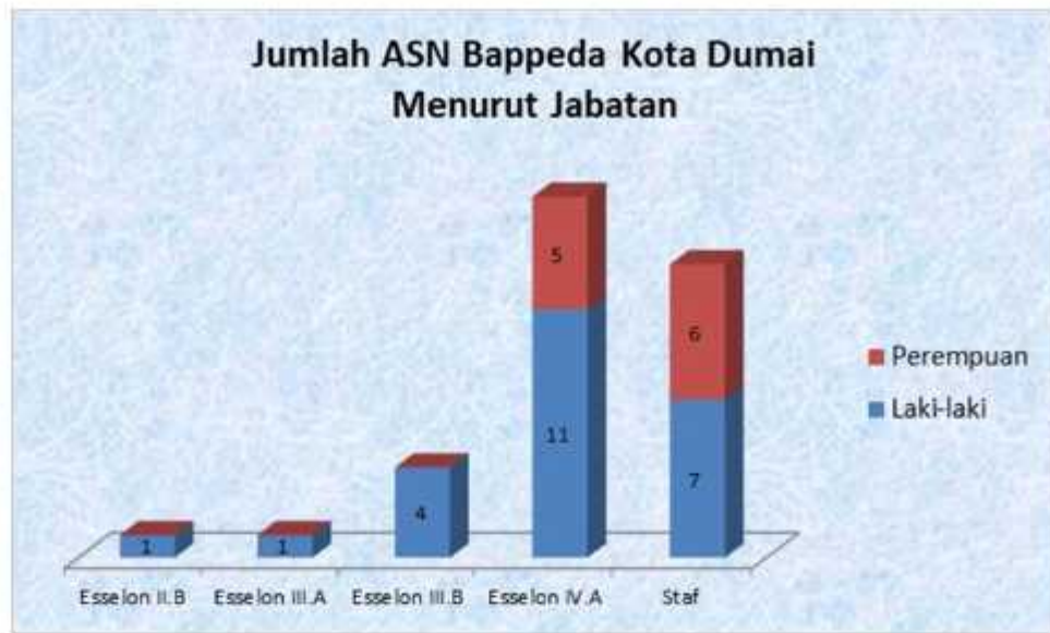
Gambar 4 Jumlah Aparatur Sipil Negara (ASN) BAPPEDA Kota Dumai Menurut Jabatan