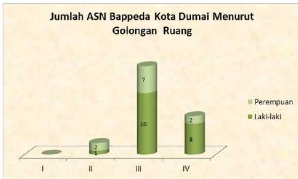
Gambar 3 Jumlah Aparatur Sipil Negara (ASN) BAPPEDA Kota Dumai Menurut Golongan Ruang

Dari gambar diatas terlihat bahwa ASN BAPPEDA Kota Dumai didominasi oleh lulusan pendidikan tinggi (91,67%). ASN lulusan S2 sebanyak 41,67% (15 orang), lulusan S1 sebanyak 47,22% (17 orang), dan lulusan D3 sebanyak 2,78% (1 orang). Sedangkan sisanya 8,33% merupakan lulusan SMA/ sederajat. Dari 91,67% lulusan pendidikan tinggi tersebut, 66,67% berjenis kelamin laki-laki dan 25 % berjenis kelamin perempuan. Jika dilihat dari golongan ruang seperti yang tersaji pada Gambar 3, seluruh ASN BAPPEDA Kota Dumai menempati golongan ruang II, III, dan IV. Menurut golongan ruang, ASN BAPPEDA Kota Dumai didominasi oleh golongan III yaitu sebanyak 23 orang, mayoritas berjenis kelamin laki-laki. ASN BAPPEDA Kota Dumai yang menempati golongan IV sebanyak 10 orang, dimana 80% nya berjenis kelamin laki-laki. Sedangkan ASN BAPPEDA Kota Dumai yang menempati golongan II sebanyak 3 orang, dimana 66,67% nya berjenis kelamin perempuan.